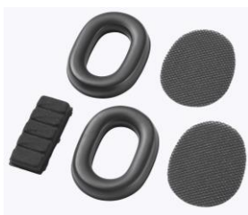
Kit hygiène – Mousses de remplacement Reference : HBG SP01