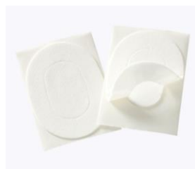
Adhésifs absorbants contre la chaleur Reference : HBG SP02