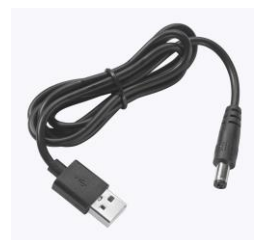
Cable de recharge USB Reference : HBG SP03