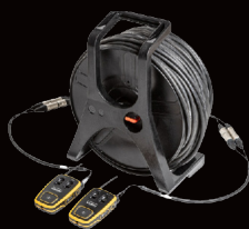
Bobine PRO 461